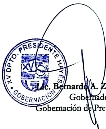
Lic. Bernardo A. Zárate Rudas Gobernador Gobernación de Presidente Hayes

En prueba de conformidad, previa lectura y ratificación de su contenido firman las partes en dos ejemplares de un mismo tenor y a un solo efecto.